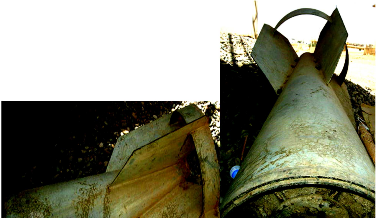
بۆمبەكان ھى كوندى سېۋىيىن - فۇتۇي ئەنقالستان - ۲۰۰۹