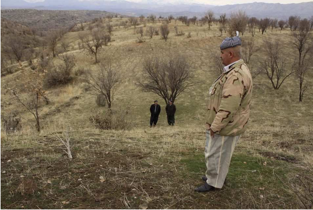
کوریمن شوینی کۆمه لکۆژییه که